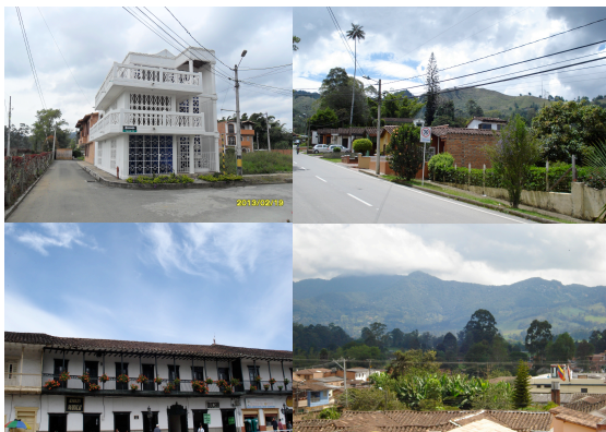
Escenas de Antioquia. La Fundación Aquamaris (izq. arriba)

Estos símbolos son completamente ajenos a un pueblo de las montañas del oeste, donde al momento del estudio encontramos “colores marinos” en la sede de la Fundación Aquamaris, cuya arquitectura (tres pisos) y la combinación de blanco y azul, se enfrentaban con la arquitectura típica de un pueblo en Antioquia, dominada por los marrones y los verdes, diferentes tonos de marrón que se observan sobre todo en madera, tejas de barro y el color verde de la naturaleza y las montañas en esa geografía.