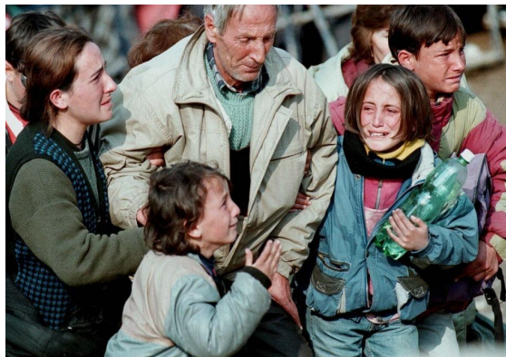
Figura 1. Refugiados de Kosovo: separación familiar, 1999

Fuente: Demir F. Kosovo Albanianrefugees, 1999. Balkan Insight. https://balkaninsight.com/wp-content/uploads/2018/02/kosovo-albanian-refugees-1999-photo-by-fehim-demir-epa.jpg 27